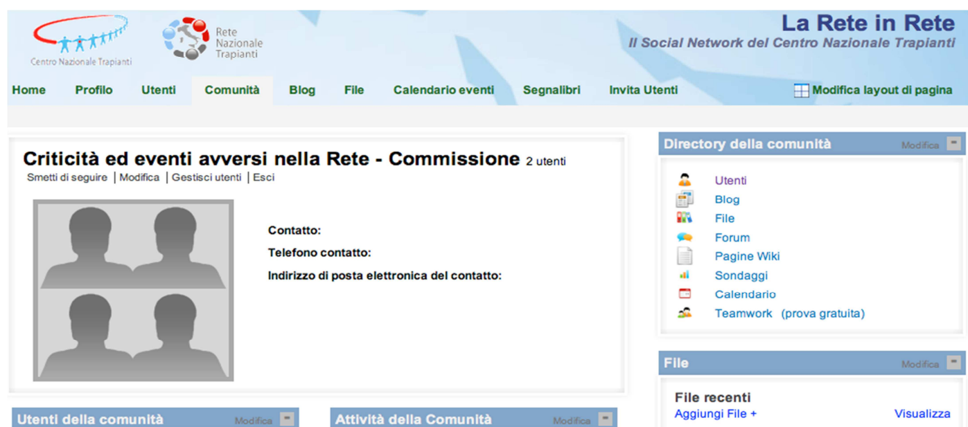
Figura 2. Screen capture della Comunità "Criticità ed eventi avversi nella rete" del social network della Rete Italiana Trapianti