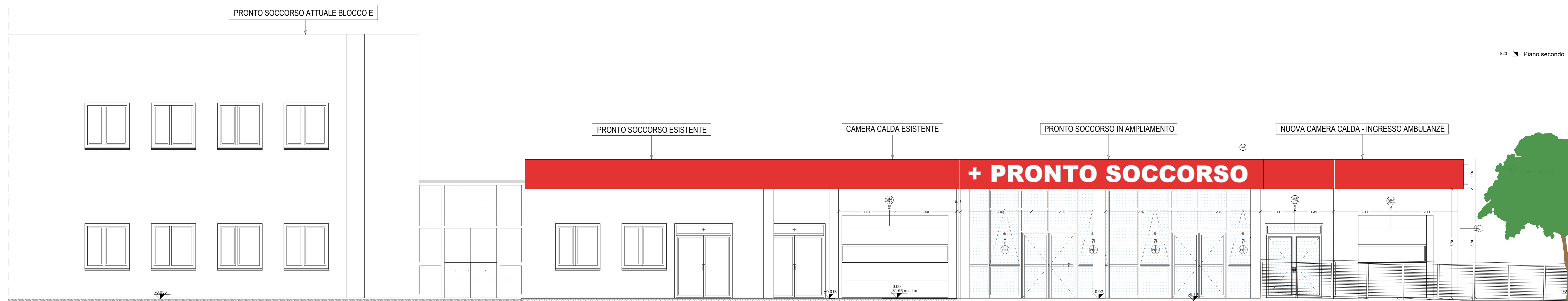
SUD - OVEST