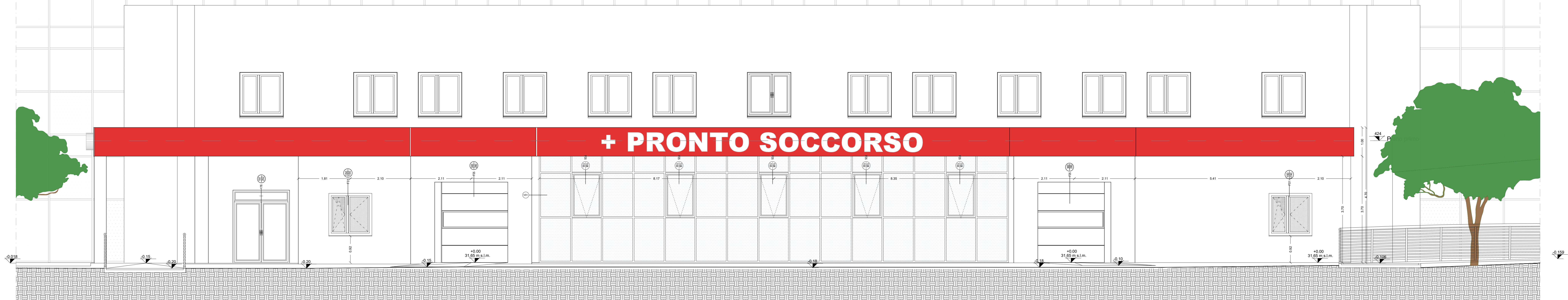
SUD - EST