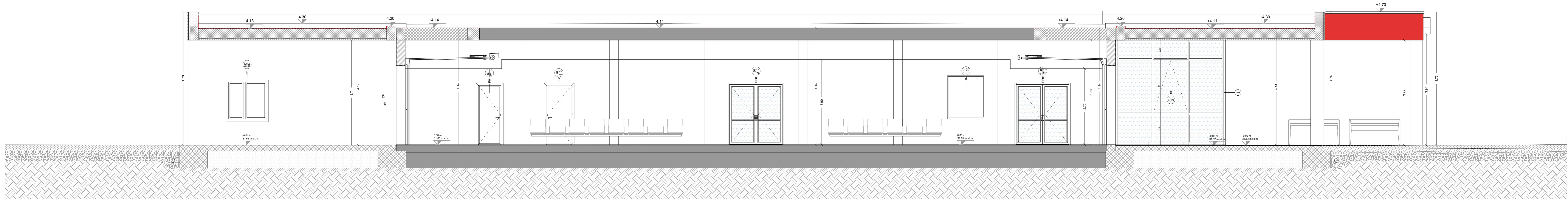
SEZIONE LONGITUDINALE EE'