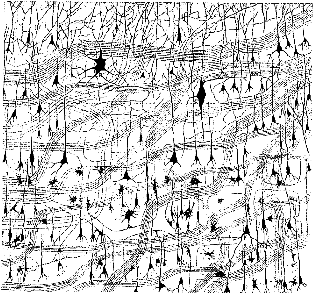
Camillo Golgi (1885)